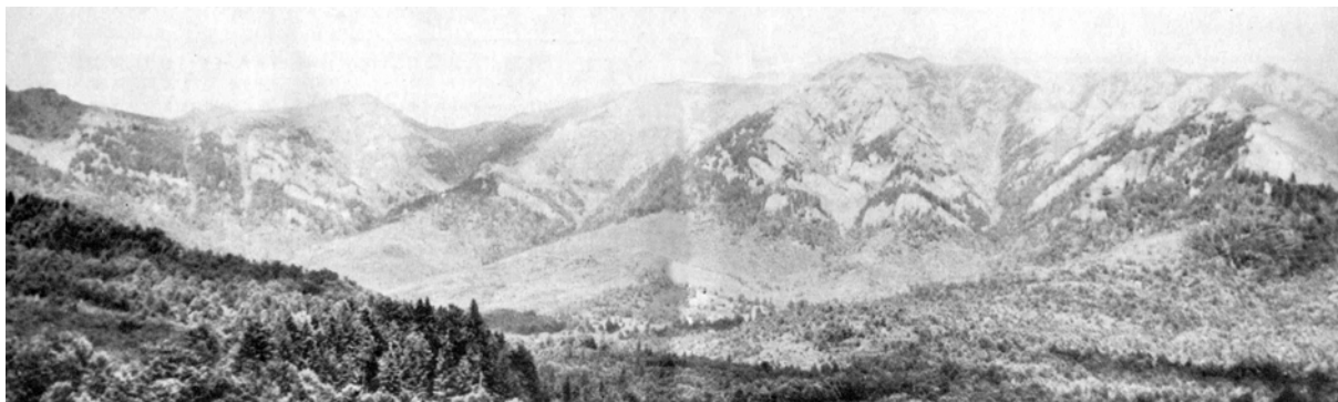
MUNȚII CIUCAȘ. PANORAMĂ