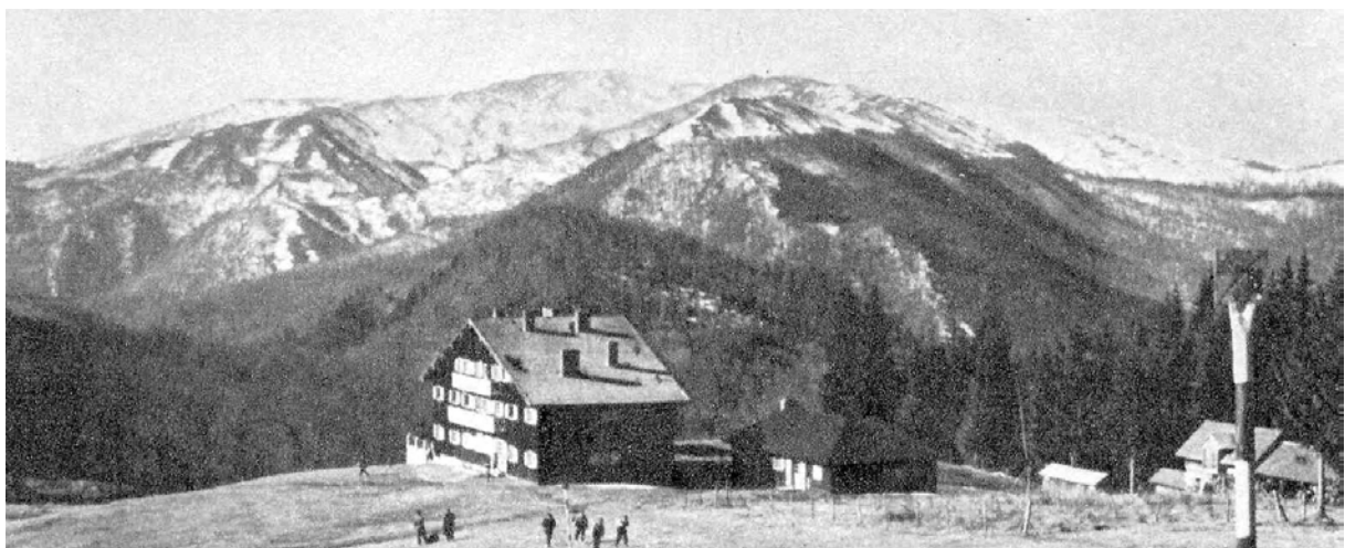
CABANA MUNTELE ROȘU

Dintre plantele specifice zonelor arătate mai sus, cităm: floarea paștelui, ghiocelul, ferigile, etc. (etajul fagului); afinul obișnuit și afinul roșu, sau coacăza, (etajul molidului), care ocupă suprafețe întinse, uneori, pînă dincolo de limita superioară a pădurii, în munții Tigăile, Gropșoarele, Zăganul. În sfîrșit, în golurile alpine se poate remarca o mare răspîndire a afinelor, bujorilor de munte și a numeroase specii de plante ierbacee, iar crestele și vîrfurile constituite din conglomerate, prezintă o foarte bogată serie de plante rare sau endemice, între care minunate exemplare de «floare de colț», uneori de o mărime neîntîlnită în alte regiuni de munte, precum și rododendronii, care alcătuiesc tufărișuri întinse.